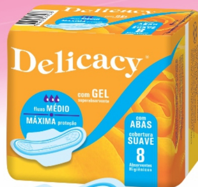
7003 Delicacy Com Abas Cobertura Suave Gel 48x8 7896378270038