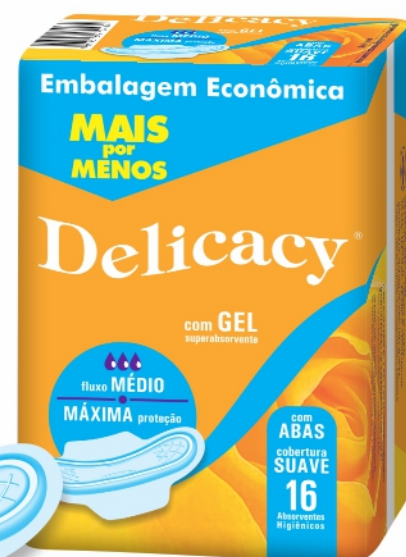
7043 Delicacy Com Abas Cobertura Suave Gel 24x16 7896378270434