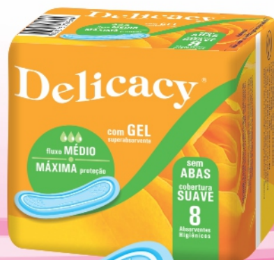
7030 Delicacy Sem Abas Cobertura Suave Gel 48x8 7896378270304