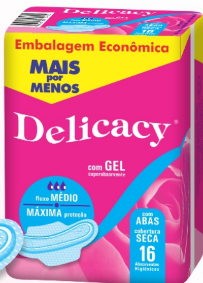
7041 Delicacy Com Abas Cobertura Seca Gel 24x16 7896378270410