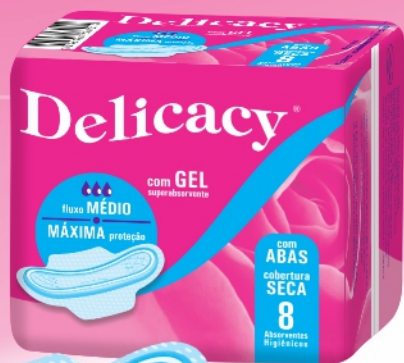
7001 Delicacy c/ Abas Cobertura Seca Gel 48x8 7896378270014